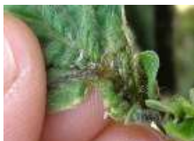
Galil 0,3 l/Ha 7DDAI