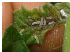
TESTIGO ABSOLUTO 7DDAI

Estudios realizados en el cultivo de Palma africana, para en el control ( Sagalasa valida ), recomiendan utilizar el insecticida GALIL a una dosis de 3,0 ml / palma,