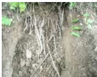
Monitoreo raíces 34 días