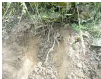
Monitoreo Inicial raíces

Estudios realizados en el cultivo de Palma africana, para en el control ( Sagalasa valida ), recomiendan utilizar el insecticida GALIL a una dosis de 3,0 ml / palma,