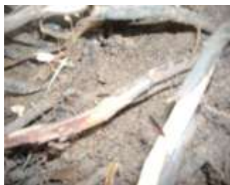
Monitoreo raíces 15 días