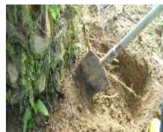
Monitoreo raíces 52 días