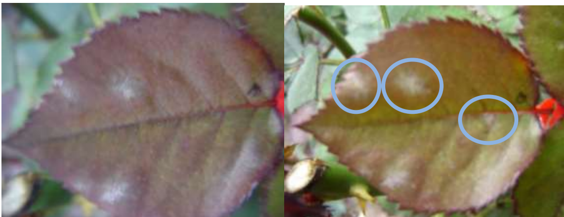
TESTIGO SIN APLICAR. Se observa incremento de la enfermedad. 3 DDA

Elaborado por: Departamento Técnico ADAMA Fecha de actualización: 15-12-2014 (EQ).