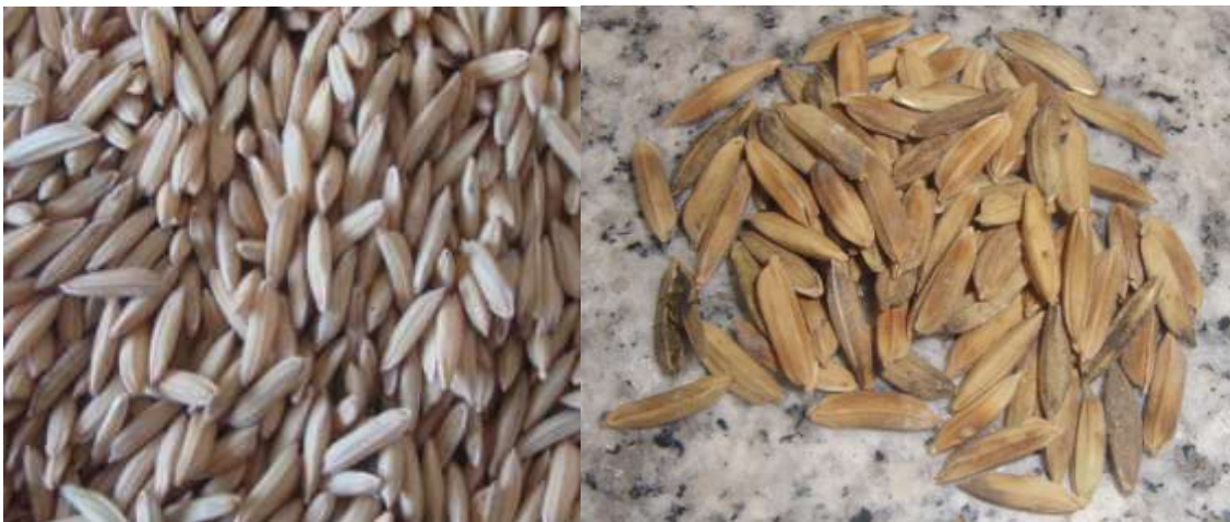
CUSTODIA (0.75 l/ha) Testigo sin aplicar (14 DDA)