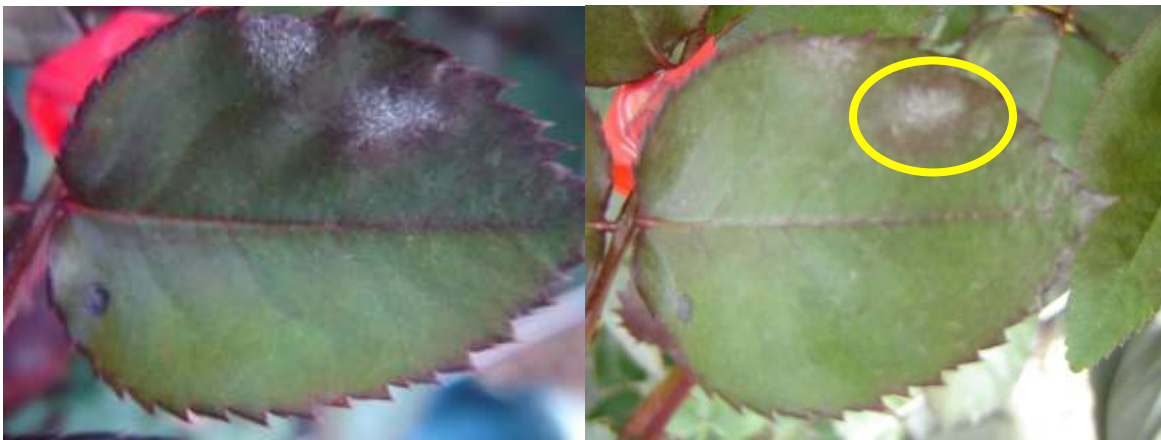
CUSTODIA (1.25 cc/l). se observa control de la enfermedad. 3 DDA