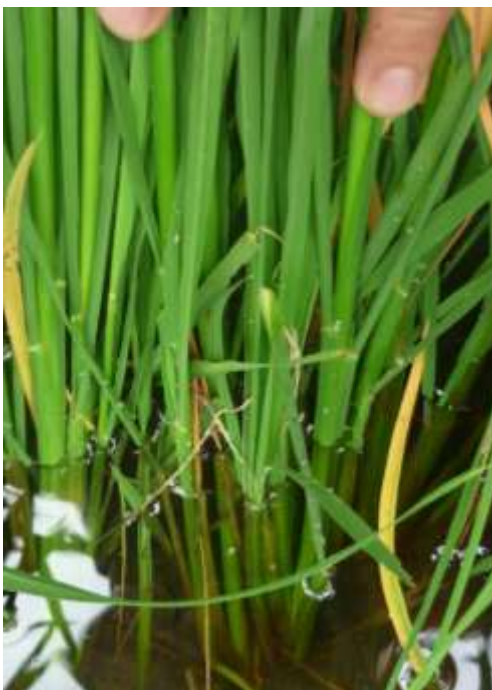
CUSTODIA (0.75 l/ha)