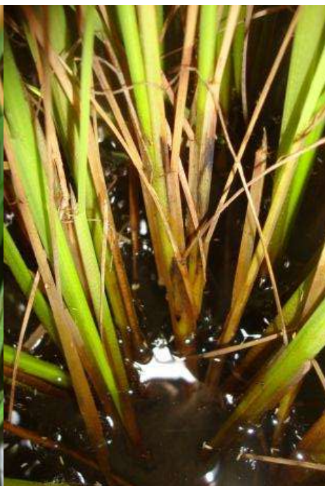
Testigo sin aplicar (21 DDA)